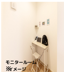
モニタールーム ※メージ