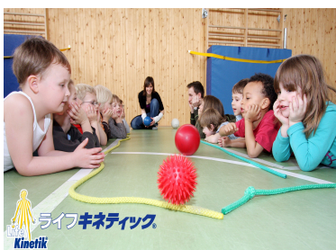
ライフキネティック Kinetik